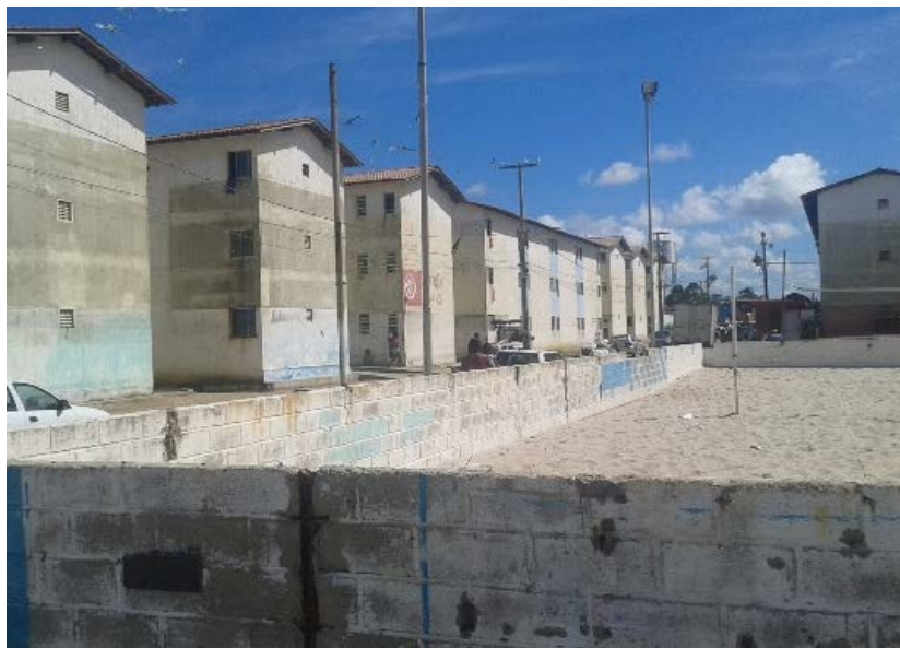
Figura 5 – Situação atual do Residencial Vila dos Pescadores: quadra de esportes deteriorada.