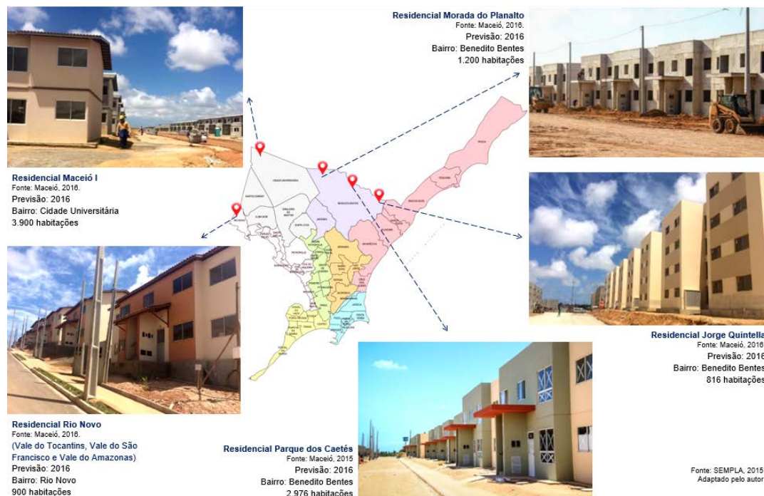
Figura 03 – Mapa de localização dos empreendimentos do PMCMV para 0 a 3 SM - Em construção.