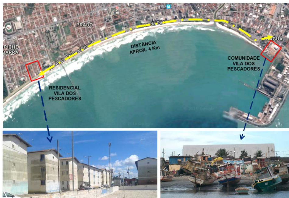
Figura 4 – Localização do atual Residencial Vila dos Pescadores no bairro Trapiche e da antiga Comunidade no bairro do Jaraguá e a distância.