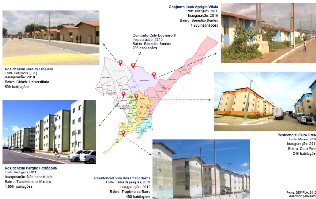
Figura 02 – Mapa de localização dos empreendimentos do PMCMV para 0 a 3 SM - Já entregues e ocupados.

desabrigadas – é o objeto de estudo desta pesquisa e será melhor descrito nos próximos capítulos (Figura 2).