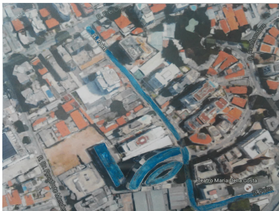
Figura 1 – Foto satélite rua Paim, destaque do Conjunto Santos Dumont (2014).

Entre 2009 e 2015, foram lançadas oito torres de apartamentos, e dois lançamentos estão programados para 2016. Em uma rua tão curta – em sua conformação atual a rua possui pouco mais de 350 metros de extensão –, essas novas construções acarretam uma mudança significativa nos fluxos da rua – pedestres e automóveis –, assim como nas funções e usos da rua – promovendo a substituição dos pequenos comércios por torres residenciais.